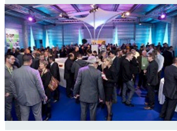
SOIRÉE CHEZ ALLIMAND