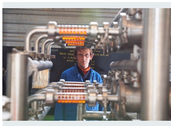
SYNTHÈSE DE COLORANTS (2)