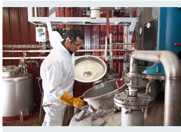
SYNTHÈSE DE COLORANTS (1)