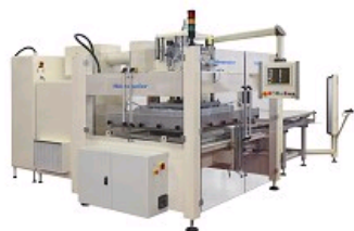
MACHINE HF MEDICAL