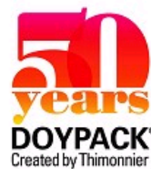
MACHINE DOYPACK® A TECHNOLOGIE ENTIEREMENT MECATRONIQUE