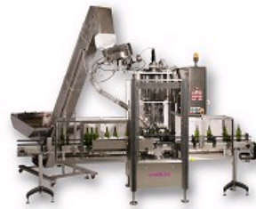
MACHINE DE SERTISSAGE INDÉPENDANTE