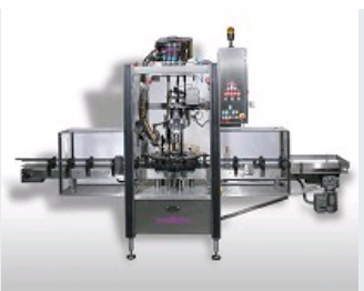
MACHINE MONOTÊTE POUR INDUSTRIE DU VIN