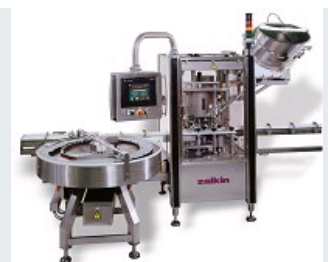
MACHINE INDEPENDANTE POUR INDUSTRIE PHARMACEUTIQUE