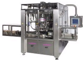
MACHINE DE VISSAGE INDÉPENDANTE