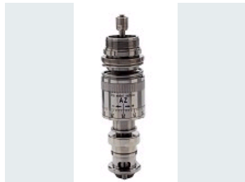
TÊTE DE VISSAGE HYSTERESIS