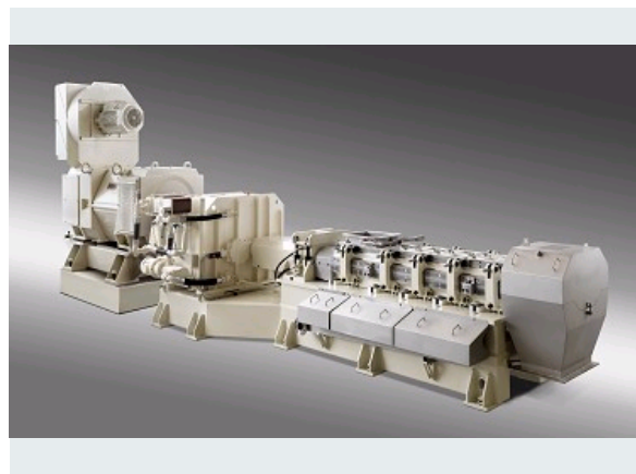
MACHINE BIVIS KRO 200