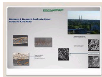
CUISINE DIAMONE & BIOGUARD - AWS, MALYN-UKRAINE