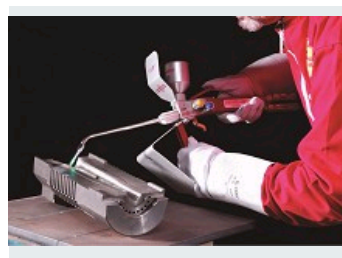
POUDRES ET ÉQUIPEMENTS DE PROJECTION THERMIQUE