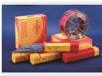
GAMME DE CONSOMMABLES ARC