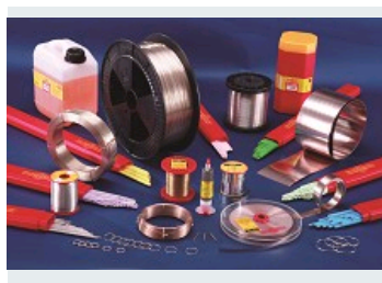
GAMME DE BRASURES ET DE FLUX