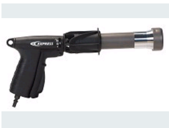
CHALUMEAU ÉTANCHÉITÉ RAPTOR LIVRÉ EN VALISETTE NOIRE EN VERSION 70 & 90 KW