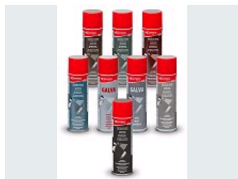
PEINTURES AÉROSOLS POUR COLORER VOS CORDONS DE SOUDURE