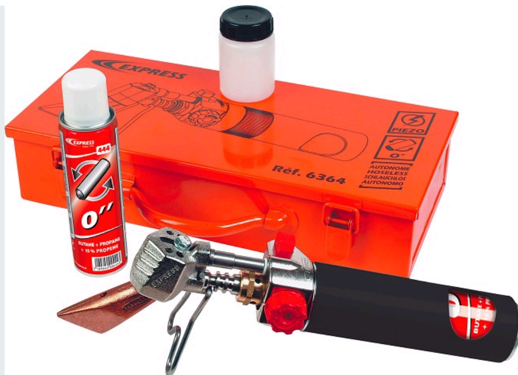
FER DE COUVREUR AUTONOME, IDÉAL POUR LES TRAVAUX DE COUVERTURE EN ZINC OU EN CUIVRE