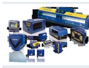
LECTEURS CODE-BARRES 1D ET 2D, IMAGEURS ET DIMENSIONNEURS