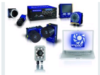
CAPTEURS DE VISION, SMART CAMERA ET SYSTÈMES EMBARQUÉS