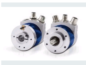
CODEURS INCREMENTAUX CODEURS ABSOLUS MONO ET MULTI-TOURS