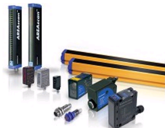
CAPTEURS PHOTOELECTRIQUES ET BARRIERES IMMATERIELLES DE SECURITE