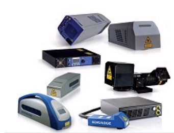
MARQUAGE LASER AVEC TECHNOLOGIES LASER FIBRE - DPSS (IR, VERT ET UV) - CO2