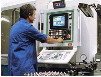
OUTILS ADAPTÉS AUX EXIGENCES MODERNES