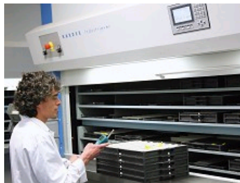
TAUX DE SERVICE > 99%