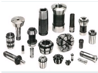
PINCES DE SERRAGE