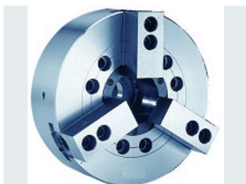
MANDRINS À MORS