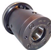
MANDRINS À PINCES