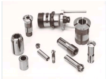
CANONS DE GUIDAGE