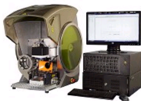
MACHINE COMPACTE DE MARQUAGE LASER LEM2 POUR BIJOUTERIE ET JOAILLERIE