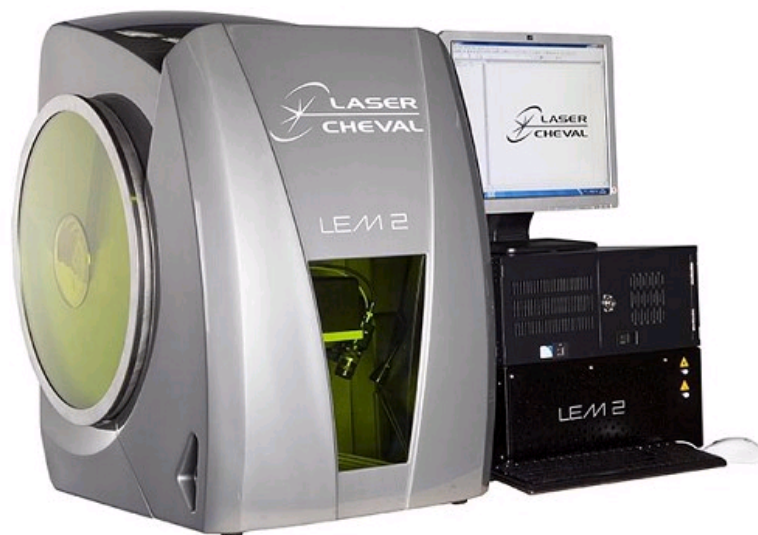
MACHINE COMPACTE DE MARQUAGE PAR LASER LEM2