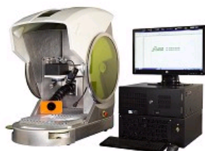
MACHINE COMPACTE DE MARQUAGE LEM2 TOPAZE AVEC PLATEAU ROTATIF