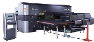
COMBINE POINÇONNEUSE / LASER FIBRE LC-C1 AJ