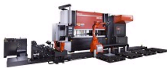
PRESSE PLIEUSE HG-ARS AVEC CHANGEUR AUTOMATIQUE D'OUTILS ET ROBOT