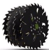
CIRCULAIRES CARBURES, AVEC OU SANS RACLEURS