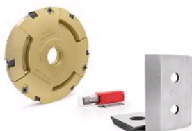
FRAISES, PORTE-OUTILS, PLAQUETTES CARBURE, FERS DE BROYEUR, RABOTAGE...