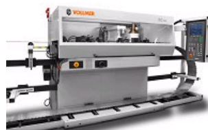
MACHINES NEUVES ET RETROFFITEES