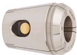
UNE INNOVATION POUR UN PROCESSUS PLUS SÉCURISÉ