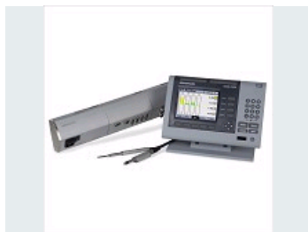
CONTRÔLE : DES RÉPONSES COMPLÈTES