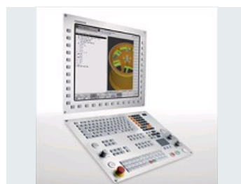
LA COMMANDE NUMÉRIQUE DE FRAISAGE-TOURNAGE POUR L'USINAGE INTÉGRAL 5 AXES À GRANDE VITESSE