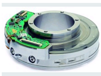
MODULES DE ROTATION DE PRÉCISION : ENSEMBLE COMPACT GARANTISSANT FIABILITÉ ET RÉPÉTABILITÉ