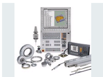
UNE GAMME GLOBALE POUR LA MESURE DE HAUTE PRÉCISION