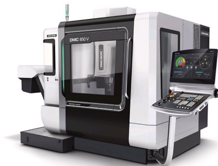
CENTRE D'USINAGE DMG MORI DMC 850 V