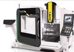
CENTRE D'USINAGE DMG MORI DMU 70 ECOLINE