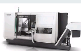
TOUR DMG MORI CTX BETA 800 TC