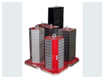
MONTAGE D'USINAGE OML