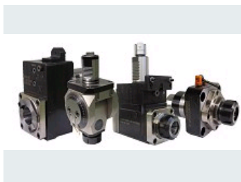
PORTE-OUTILS TOURNANTS POUR LES TOURELLES DE TOURS À COMMANDE NUMÉRIQUE