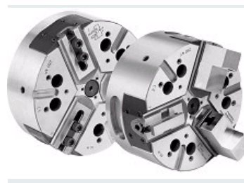
MANDRINS ETANCHES POUR LES PRODUCTIONS GRANDE SERIE