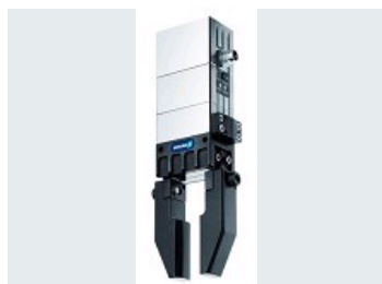
PINCE EGP- LA PINCE DE PRÉHENSION ÉLECTRIQUE LA PLUS PUISSANTE DU MARCHÉ