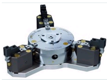
ROTA-S FLEX MANDRIN MANUEL HYPERFLEXIBLE