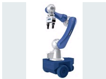
BRAS POWERBALL LWA 4P LE BRAS LÉGER LE PLUS COMPACT ET PERFORMANT POUR LES APPLICATIONS MOBILES