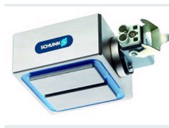
PINCE DE PRÉHENSION MAGNÉTIQUE EGM, UNE FORCE DE SERRAGE MAXIMUM, UN ENCOMBREMENT RÉDUIT