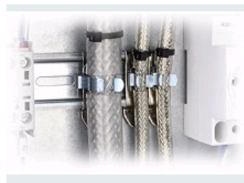
SFZ|SKL BORNE DE BLINDAGE