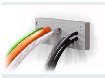
KEL-DPU 24 IP66 - IP68