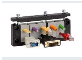
KEL-ER 24 IP66