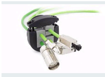
KVT-ER IP66 - IP68