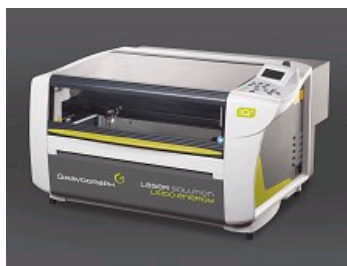
ENERGY 8 : SOLUTION DE GRAVURE LASER ABORDABLE ET DE HAUTE QUALITÉ