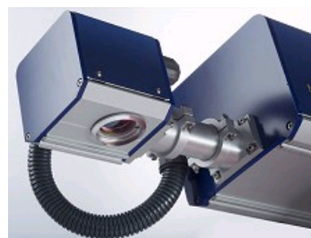
SERENITY® : SOLUTION LASER DE CODAGE