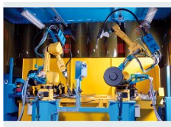
CELLULE DE SOUDAGE ROBOTISÉ - MACHINE SPÉCIALE