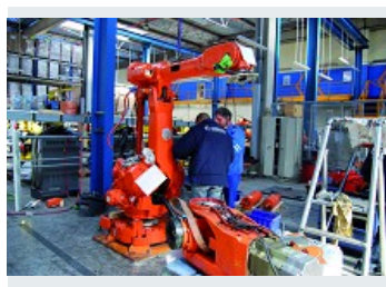
RÉNOVATION MÉCANIQUE, ÉLECTRIQUE ET LOGICIELLE DE ROBOTS TOUTES MARQUES