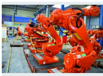
ÉQUIPEMENT ROBOT - CHANGEMENT MÉTIER