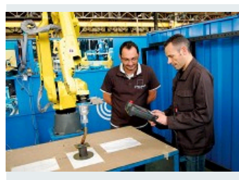
FORMATION DES OPÉRATEURS AUX PROCESS ET LOGICIELS