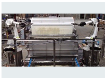
DEPOCHAGE AUTOMATIQUE D'UN FILET CONTENANT DU FROMAGE