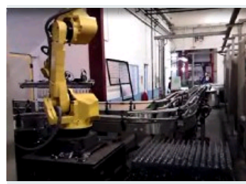
CHARGEMENT ET DECHARGEMENT SUR CONVOYEUR AVEC TRACKING