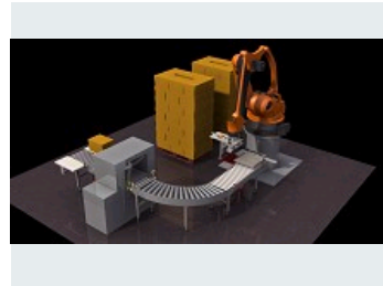
ILOT DE PALETTISATION DE CARTON