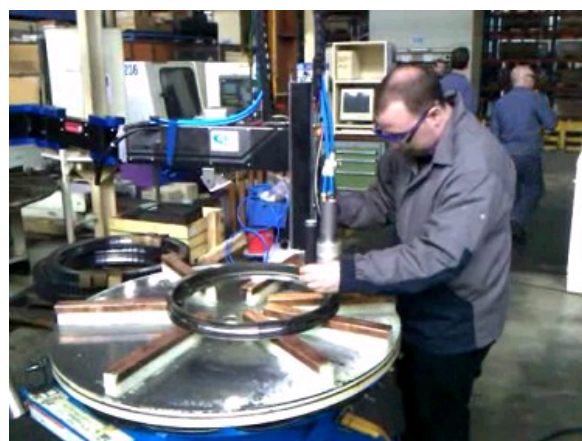
ROBOT COLLABORATIF 1 AXE