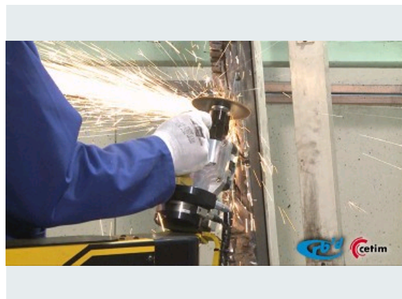
ROBOT COLLABORATIF 6 AXES POUR LE MEULAGE