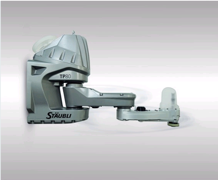
ROBOT FAST PICKER TP80 HE, CONÇU POUR DES OPÉRATIONS DE PACKAGING EN ENVIRONNEMENT AGROALIMENTAIRE.