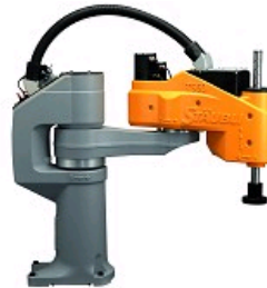
ROBOTS SCARA DE 220 À 800 MM DE RAYON D'ACTION, CHARGE MAXIMALE 8 KG