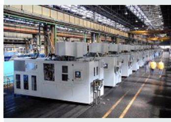
SMART DRIVE COMAU